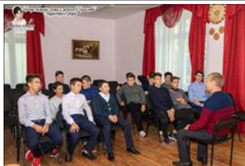
Занятия с подростками группы риска