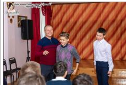
Занятия с подростками группы риска Занятия с подростками группы риска