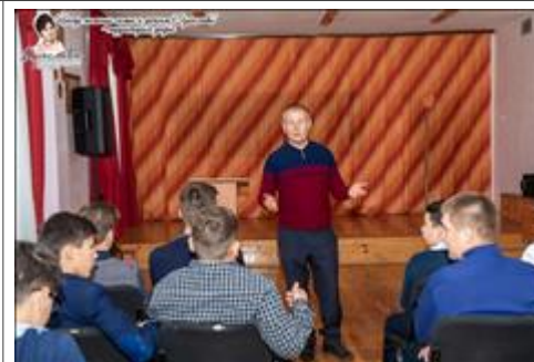
Занятия с подростками группы риска