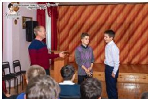
Занятия с подростками группы риска Занятия с подростками группы риска