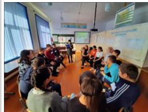
Фото открытых уроков Элемент тренинговой работы со школьниками в направлении семейных ценностей